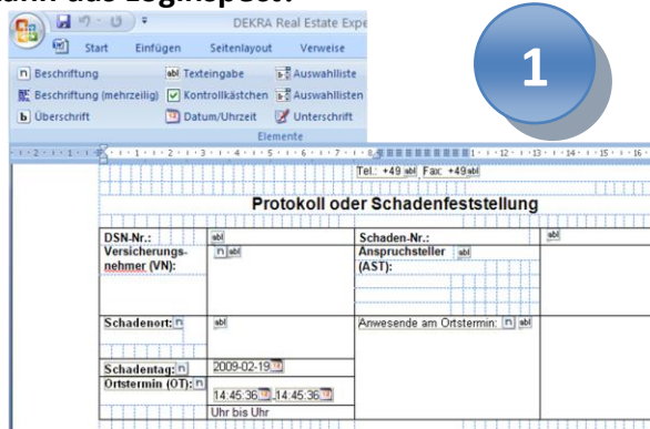
Loginspect Word Addin